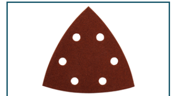
Schuurvel 3-k 94mm K150 Red Velcro (1 stuks) - P-33308 - 0088381961462

Dit is slechts een kleine greep uit het ruime assortiment. Kijk voor alle accessoires/verbruiksartikelen in de Catalogus of op www.makita.nl .