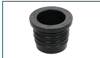
Koppeladapter ribbedx22mm (1 stuks) - 417408-5 - 0088381157872