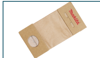
Papieren stofzak (1 stuks) - 193712-3 - 0088381181730