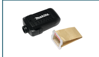
Stofbox met papieren stofzak (1 stuks) - 135246-0 - 0088381403528