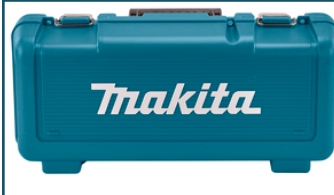
Koffer (1 stuks) - 824806-0 - 0088381346092