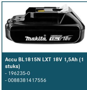
Accu BL1815N LXT 18V 1,5Ah (1 stuks) - 196235-0 - 0088381417556