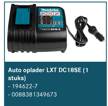
Auto oplader LXT DC18SE (1 stuks) - 194622-7 - 0088381349673

Dit is slechts een kleine greep uit het ruime assortiment. Kijk voor alle accessoires/verbruiksartikelen in de Catalogus of op www.makita.nl .