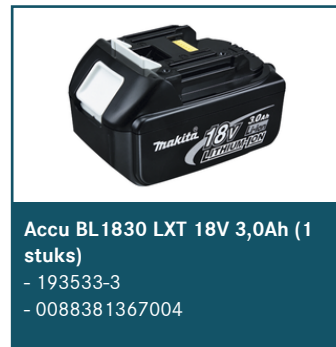
Accu BL1830 LXT 18V 3,0Ah (1 stuks) - 193533-3 - 0088381367004