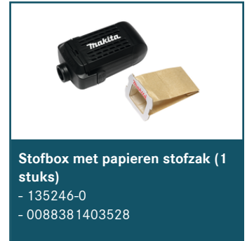
Stofbox met papieren stofzak (1 stuks) - 135246-0 - 0088381403528