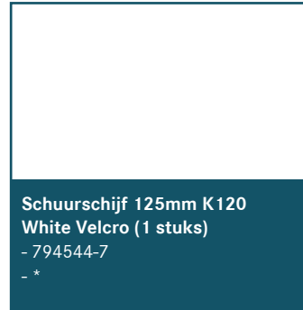
Schuurschijf 125mm K120 White Velcro (1 stuks) - 794544-7 - *