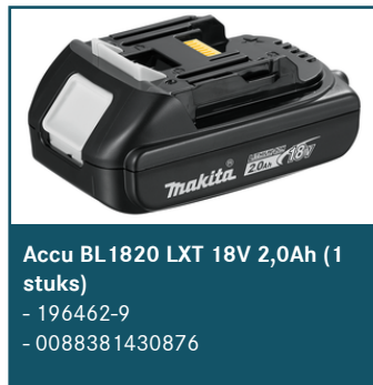
Accu BL1820 LXT 18V 2,0Ah (1 stuks) - 196462-9 - 0088381430876