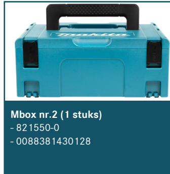
Mbox nr.2 (1 stuks) - 821550-0 - 0088381430128