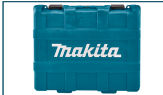
Koffer (1 stuks) - 821568-1 - 0088381437516