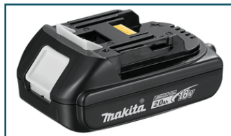
Accu BL1820 LXT 18V 2,0Ah (1 stuks) - 196462-9 - 0088381430876