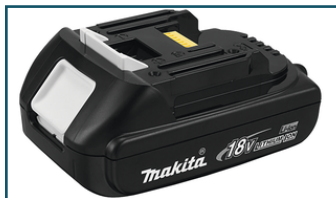
Accu BL1815 LXT 18V 1,3Ah (1 stuks) - 195445-6 - 0088381367455