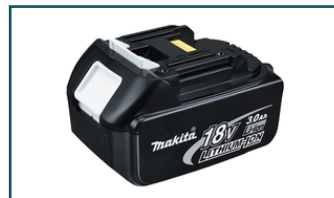
Accu BL1830 LXT 18V 3,0Ah (1 stuks) - 193533-3 - 0088381367004