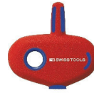
TXP7 - TXP15